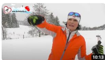
Běžkotoulky 2023 - Lipensko