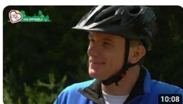
Cyklotoulky 2023 - Lipno