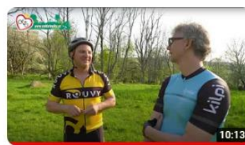
Cyklotoulky 2023 - České Žleby